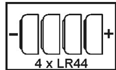
Obr. 5.1. Správné umístění baterií

Pozor na polaritu (+/-) baterií. Baterie umístěte do zařízení podle obrázku 5.1.